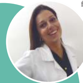
JULIANA ZASSO Coordenação Editorial

em www.acaomagistral.org.br e fique por dentro de dicas e novidades no Instagram: @acaomagistral